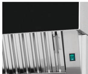
Extracción ventless (opcional)