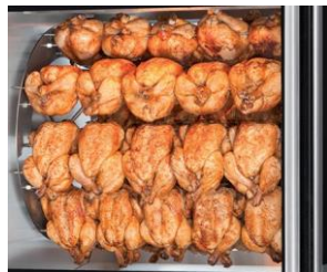
Área grande para exhibir el producto